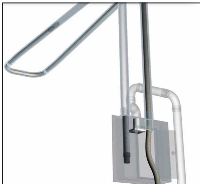
Rys. 2. Wyciąganie węża i przygotowanie do pracy

Aby rozpocząć korzystanie z systemu, wyciągamy wąż ssący z osobnej nitki rurociągu przeznaczonej wyłącznie do jego przechowywania. Następnie podłączamy wąż do gniazda ssącego znajdującego się w kasecie systemu HOSE-IN i rozpoczynamy pracę. Po skończonej pracy wąż ssący przez wytworzone przez odkurzacz podciśnienie jest z powrotem zasysane do specjalnej czystej nitki rurociągu. Więcej informacji i film instruktażowy dostępny na youtube.