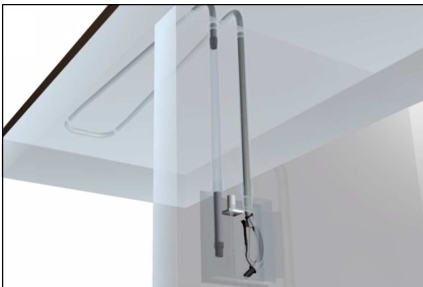
Rys. 1. Osobna nitka rurociągu do przechowywania węża