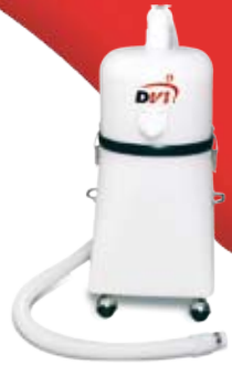
► Separatory płynów i pyłu