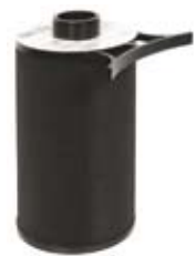
► Filtr wydechowy ACTIVAC 2™ z aktywnym węglem i systemem filtracji HEPA