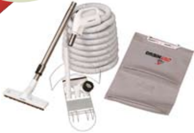
► Luksusowe akcesoria