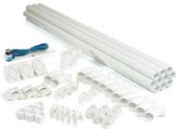
► Zestawy samodzielnego montażu