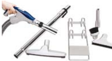
► Zestawy akcesoriów