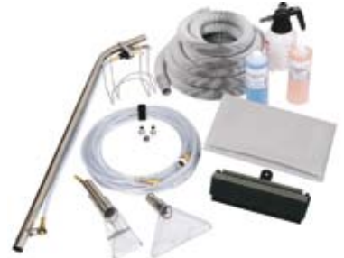
► Zestawy czyszczące