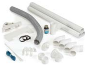
► Zestaw instalacyjny szufelki automatycznej